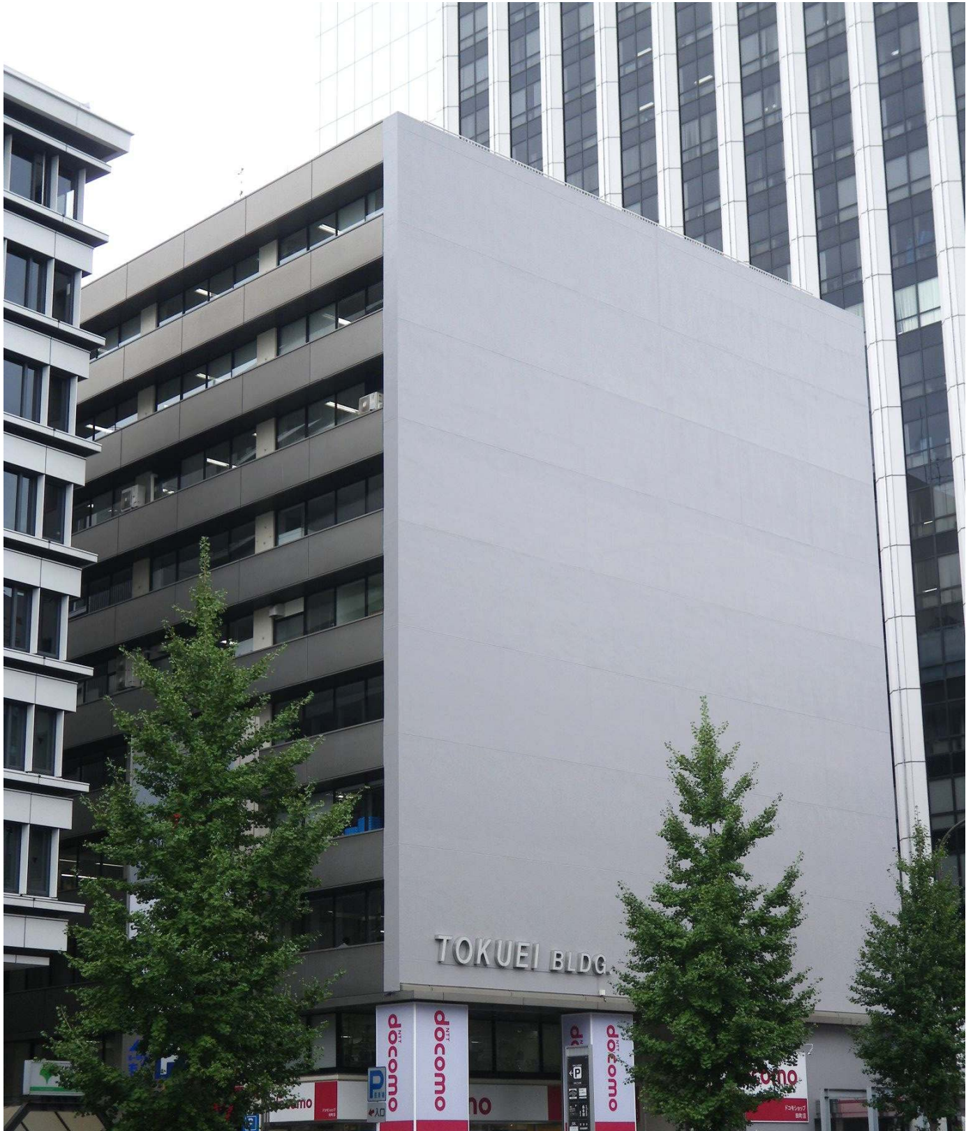
徳栄ビル本館外観